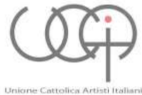
Unione Cattolica Artisti Italiani

za, e negli anni è riuscita ad avere ottimi risultati. Tutt'ora la cadenza delle mostre è ogni quindici giorni, un bel ritmo, non vi pare? Nel ciclo di concorsi di letteratura che concluderà il ventennio l'anno prossimo, poi, ricordiamo il premio dato a Susanna Tamaro. In poesia, tra i più grandi, c'è sicu-